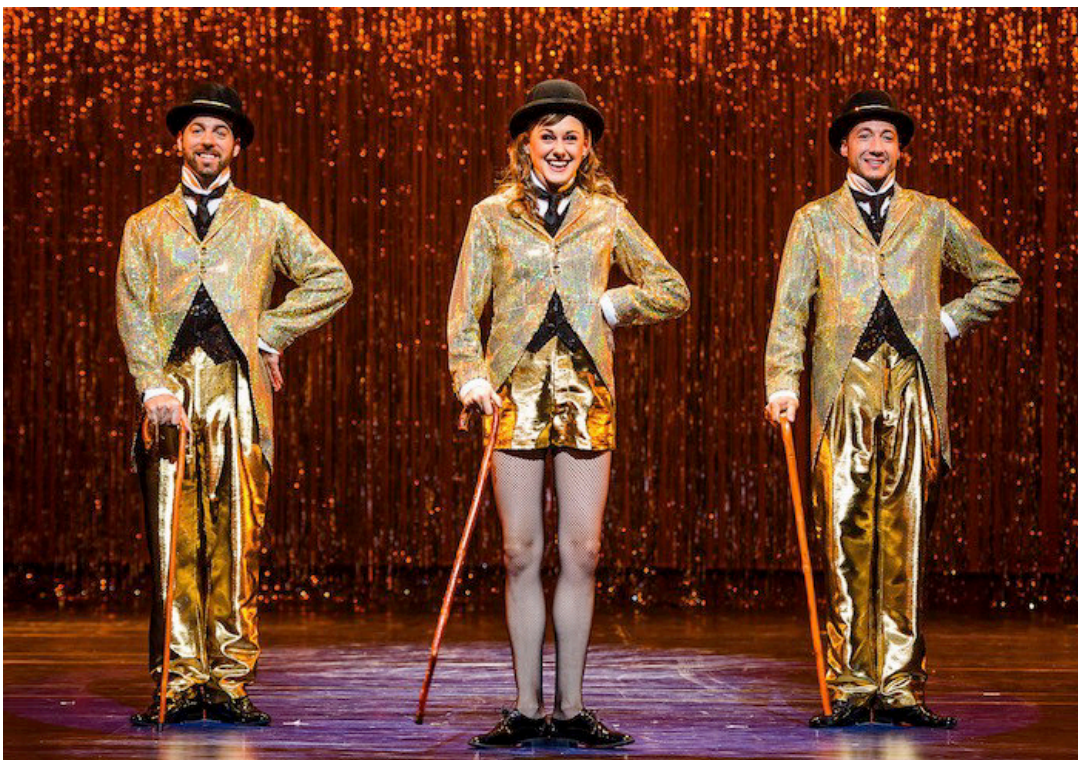
Das Schweizer Mundart-Musical «lo senza te» startet am 15. Juli.

Vom 15. Juli bis 29. August präsentieren die Thunerseespiele das Schweizer Mundart-Musical «lo senza te» mit den legendären Hits von Peter, Sue und Marc. An der Matinée-Vorstellung vom Samstag, 15. August, lancieren die Musicalmacher zum ersten Mal in ihrer Geschichte eine Mitsing-Matinée.